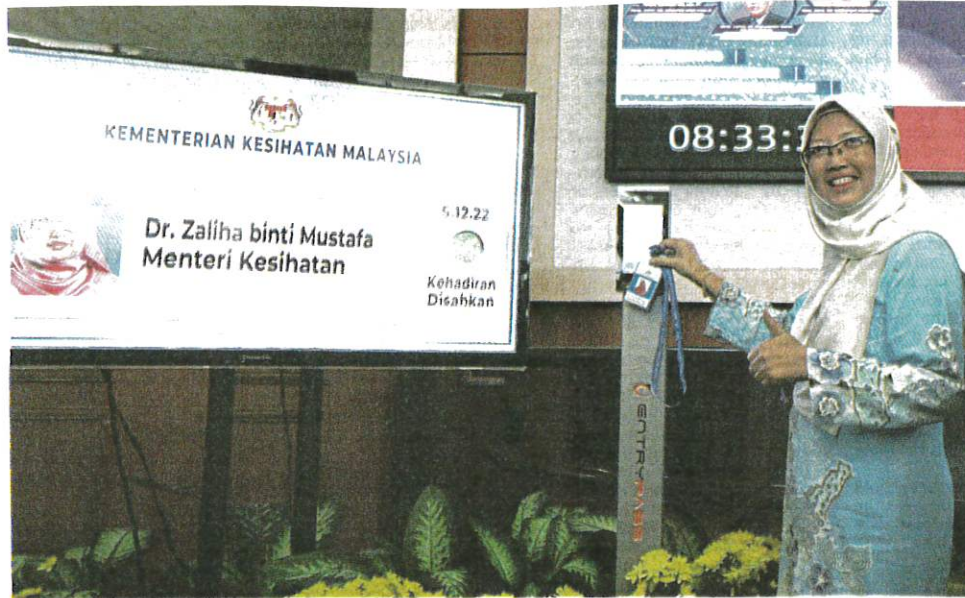
Health Minister Dr Zaliha Mustafa clocking in at the Health Ministry in Putrajaya yesterday.

"I am open to suggestions or opinions from former health ministers. But as a new minister, I will get a briefing from the ministry's officials and see which policies we can adopt, improve or reject," she said at the ministry here.