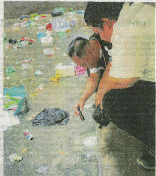
Pegawai Jabatan Kesihatan Pulau Pinang sedang memeriksa lantai di bahagian bawah flat ketika operasi dijalankan.

"Difahamkan pihak pengurusan flat ada memasang kamera litar tertutup untuk memantau penduduk yang membuang sampah tetapi gayanya keadaan masih sama. Penduduk di sini 60 peratus adalah warga tempatan manakala bakinya warga asing yang menyewa," katanya.